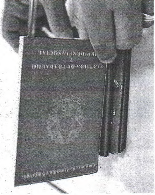
EM ABRIL, o setor de serviços foi o que mais gerou novas vagas formais no Ceará |

Estado do Ceará – Prefeitura Municipal de Pacajus. A Prefeitura Municipal de Pacajus-CE, avisa no dia 15 de junho de 2023, às 9:00h, realizará licitação, na modalidade Pregão Eletrônico Nº 2023.05.29.02, com fins de Registro de Preços para futura e eventual aquisição de material para construção de calçadas e pavimentos do Município, junto a Secretaria de Infraestrutura e Desenvolvimento Urbano da Prefeitura Municipal de Pacajus-CE, conforme edital disponível na Sede da Comissão e nos sites: https://municipios.ce.gov.br/licitacoes , https://www.bimnet.com.br , https://www.bimnet.com.br , Pacajus/CE, 30 de maio de 2023.