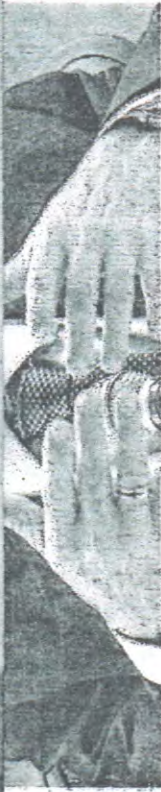
BARROSO defendeu decisão do STF sobre imprensa