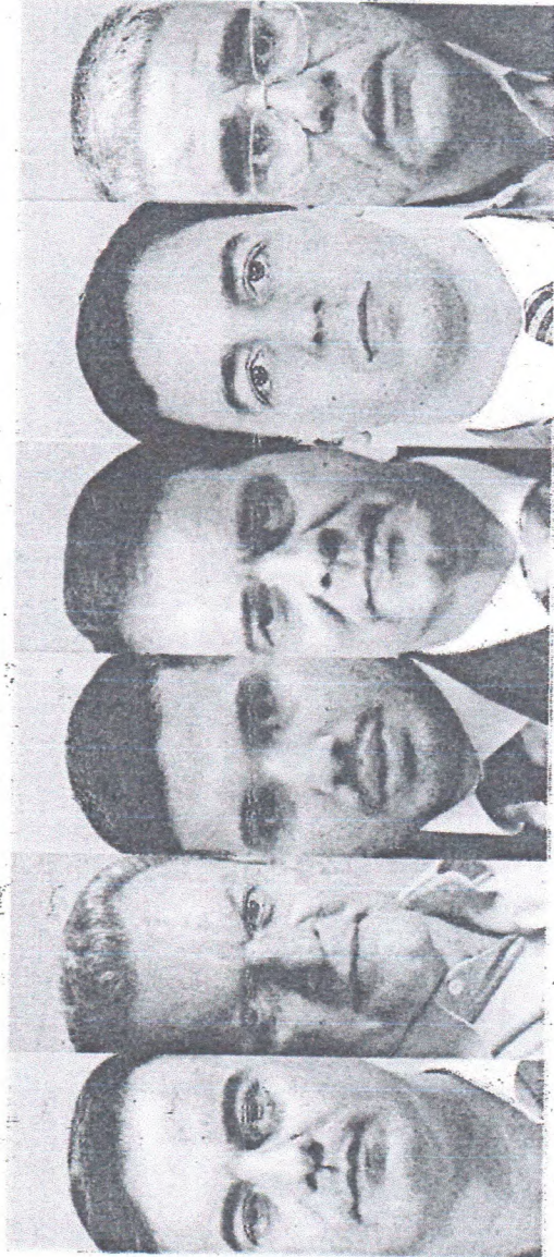
PRIMEIRA pesquisa Datafolha para Prefeitura de Fortaleza foi divulgada nesta quinta, 27